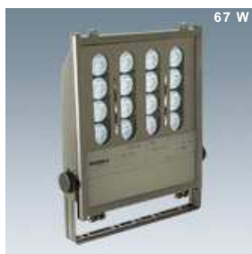
Proiettore con lampade Led 67 W

La riduzione della intensità dell'illuminazione pubblica notturna va di pari passo con l'esigenza di riduzione dei consumi di energia elettrica. Tuttavia, la presenza di illuminazione notturna legata alle esigenze di sicurezza dei locali pubblici rende necessaria l'installazione di plafoniere e proiettori, sovente ad accensioni crono programmate da timer, la cui potenza incide il più delle volte sul profilo di carico notturno utente per le eccessive potenze di lampada impiegate.