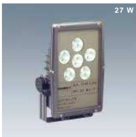
Proiettore con lampade Led 25 W