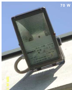
Proiettore con lampade sodio 70 W