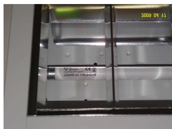
Tubi slim G5 da 14 W/ciascuno